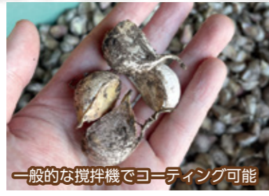
一般的な攪拌機でコーティング可能