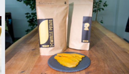
アスリート向けの焼き芋、その名もマッスルポテト