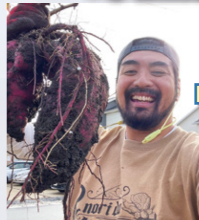
「息吹はずっと使います」とノリさん。