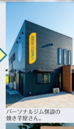
パーソナルジム併設の焼き芋屋さん。