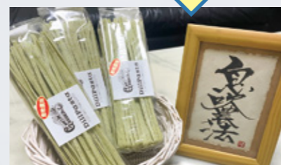
ディルというハーブを練り込んだパスタ。

「今回の全国的な病気や、天候を予測しながら、植える株間、つる返しの回数、タイミングを読み切った!」 息吹LDのおかげでイイ作物ができた!とコメントは完全なるプロ農家でした。